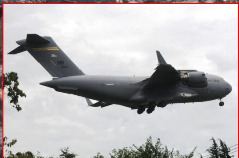
C-17 グローブマスター