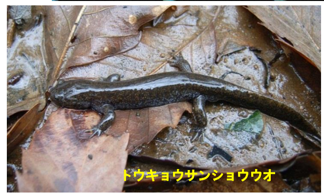
トウキョウサンショウウオ