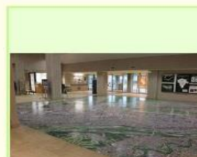
瑞穂町郷土資料館 けやき館ホームページへ

郷土資料館けやき館内の町全域航空写真「パースアイ瑞穂(10×10m)」にタブレットをかざすと、71箇所の町のみどころや町並みなど、今と昔の写真を見ることができます。また、関連した音声(鳥の鳴き声や蒸気機関車の音)も聞くことができます。