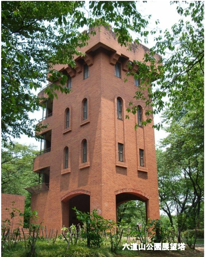
六道山公園展望塔