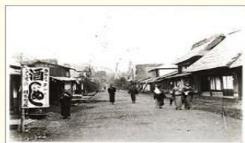
日光街道 明治35年頃撮影

瑞穂町では、図書館と郷土資料館が所有する地域資料等を、デジタル化してインターネットで公開しています。